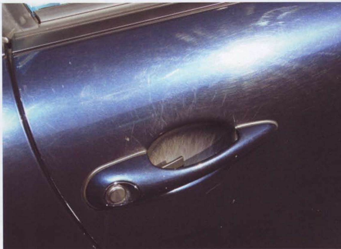
Die „klassischen“ Vorher-Nachher-Beispiele...

mit einem Applikationschwamm dünn aufgetragen. Bereits nach einer Einwirkzeit von 20 Minuten werden die Versiegelungsreste mit Mikrofasertüchern entfernt und schon ist man fertig. Strahlen-