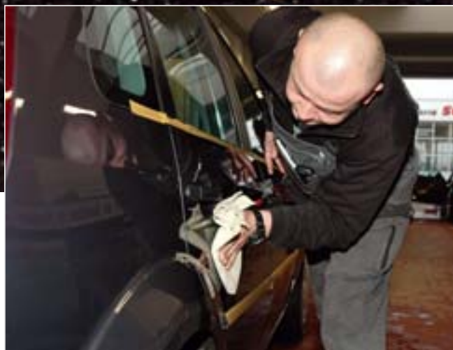
Nach etwa 20 Minuten Einwirkzeit wird die Versiegelung mit einem Mikrofasertuch abgewischt.

„Fit für den Winter“ kann man dann argumentieren, dass ein versiegelter Lack den winterlichen Beanspruchungen durch Streusalz, Rollsplitt und Nässe besser standhält. Die Lackversiegelung im Rahmen von Aktionen anzubieten hat aber auch noch weitere Vorteile: Der Kundenverkehr lässt sich so besser steuern, und personelle Kapazitäten lassen sich besser einplanen.