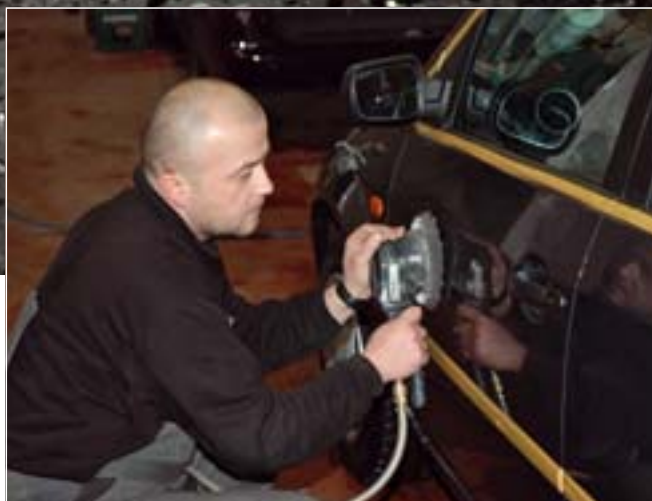
Die Versiegelung wird mit der Exzenter-Poliermaschine und einem Waffel-schwamm dünn aufgetragen.